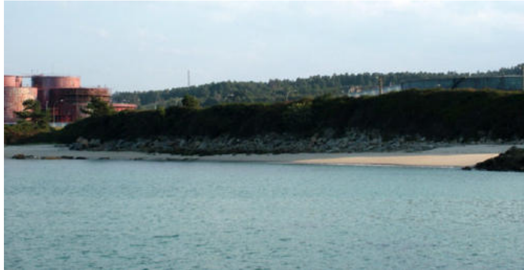
A planta de alumina e a praia de Paraños, onde se soían bañar os habitantes de Bidueiros.

Escribo isto o mesmo día que meu pai tería cumprido 77 anos. Dos 65 que puido desfrutar (e nós del), máis ou menos a metade viviunos (cando estaba en terra, claro) en Bidueiros . Naquela aldea estaban o 100% das miñas raíces. Meu pai era da Aldea de Baixo e miña nai da de Riba . Separábaos a vía do tren (ou, ben certo, daquela solo o terreo explanado para instalar as travesas e raíles).