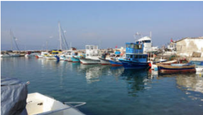
Embarcaciones pesqueras de Turquía

Galicia mostrará a Turquía cómo se trabaja con las organizaciones de productores de pesca y ayudará a reforzar las capacidades del mercado pesquero del país