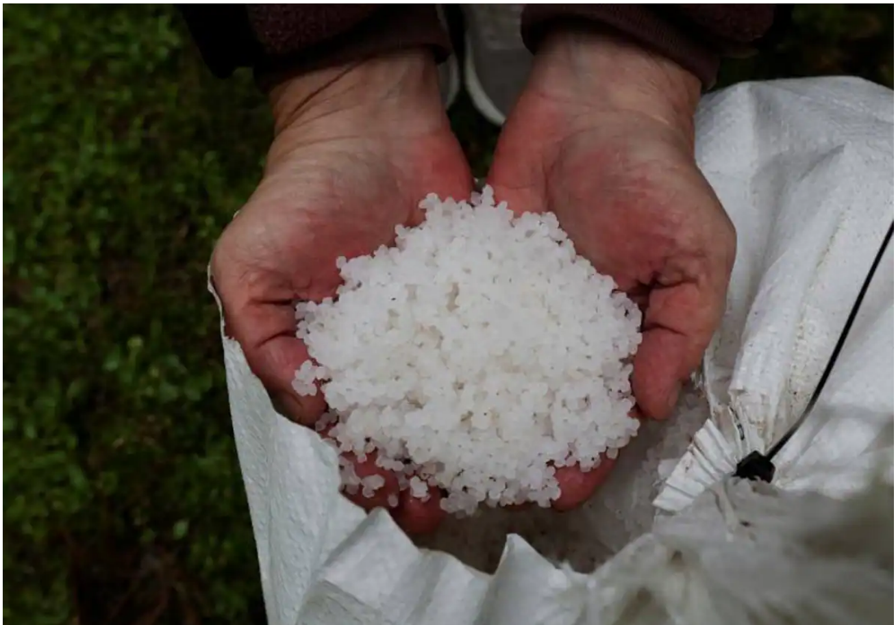
Miles de pellets recogidos en una playa, en Ribeira (La Coruña)

Vertido de pellets en Galicia, en directo: llegada de los microplásticos a Asturias y últimas noticias hoy