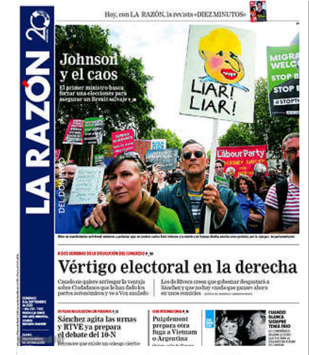
Las Portadas de los Periódicos