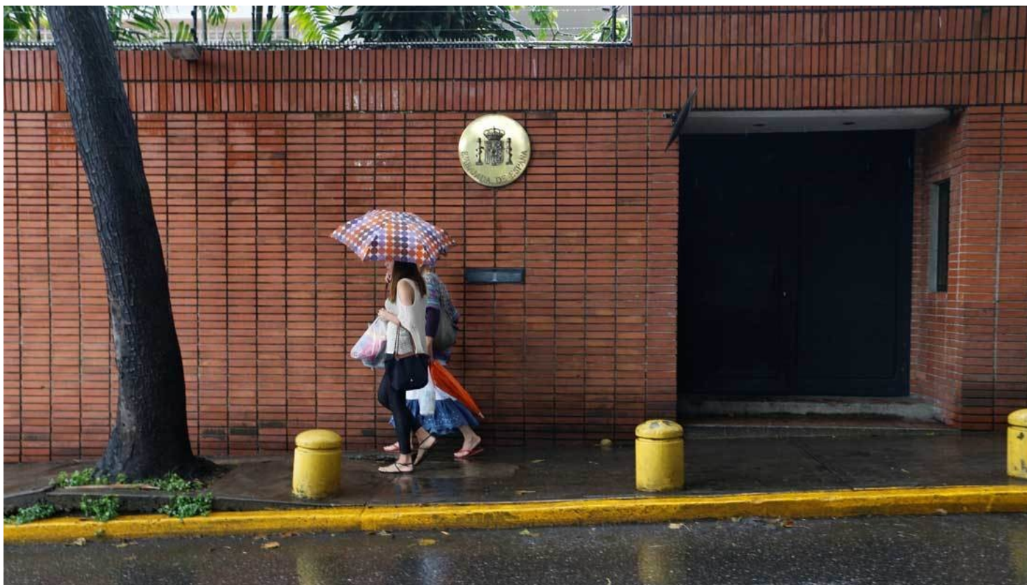
Embajada española en Caracas, Venezuela, 3 de agosto de 2017.

venezolano, multiplicando los fondos que habían sido enviados a la Fundación España Salud, que se dedica a la atención de migrantes españoles. Las operaciones se habrían realizado entre 2015 y 2016.