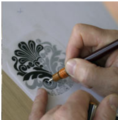
Modelos de decoración