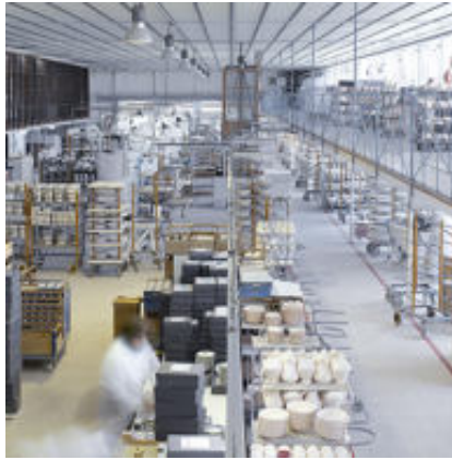
Interior Fábrica de O Castro