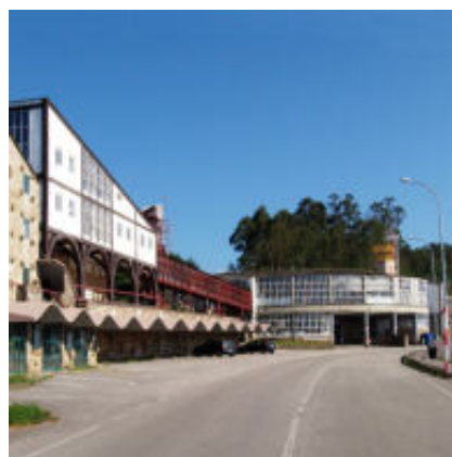
Fábrica de Sargadelos