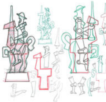
Bocetos Figura Quijote

joyerías que comercializan nuestros artículos en España y otros países.