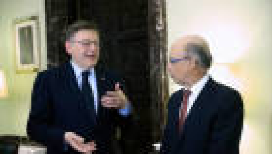
Ximo Puig maquilla el déficit

con más ingresos y un parón en las inversiones