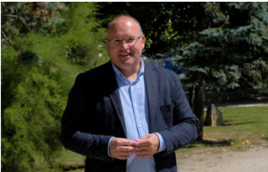
Miguel Tellado es cabeza de lista por el PP de la provincia