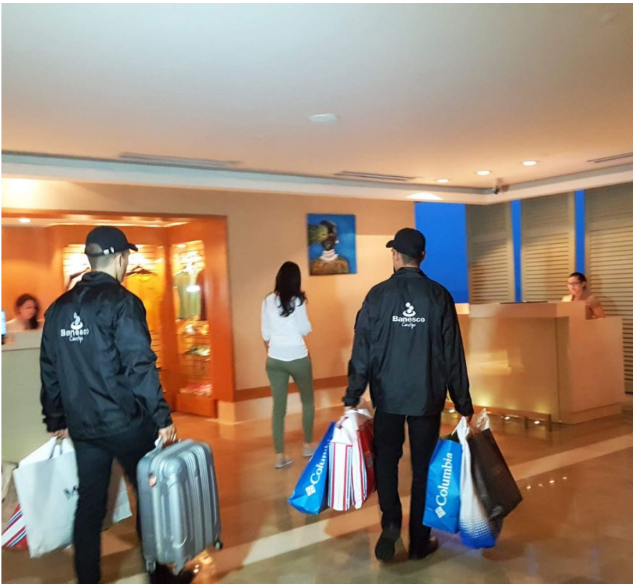
Foto Llegada del equipaje de Escotet al hotel de Panama... ; viva el vino !